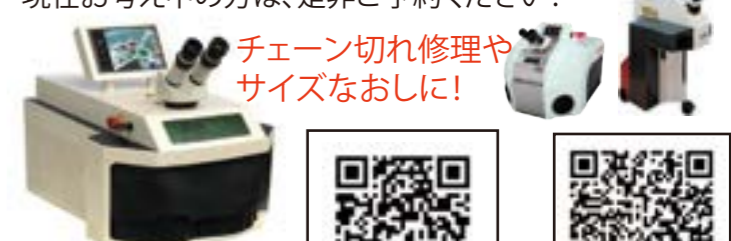
小型レーザー溶接機【SL10】 ¥1,430,000 (税別)

レーザー溶接機があればお店でも修理が可能に!他店との差別化にも最適です。でも実際に自分でも出来るのかな。。。そんなお悩みも体験会で解決できます。今回は低価格レーザー溶接機【SL10】を体験できます。現在お考え中の方は、是非ご予約ください!