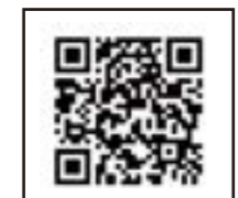
商品詳細動画はこちら