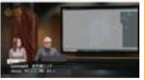
オンライン配信画像

3 DESIGN Pro又はデザインをご購入で、「オンライン配信講座 初級」¥68,000税別をプレゼント!!