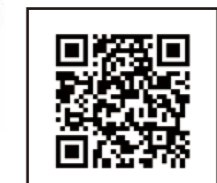
商品詳細動画はこちら