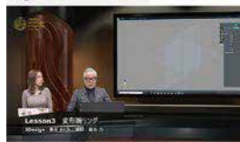
オンライン配信画像

3 DESIGN Pro又はデザインをご購入で、「オンライン配信講座 初級」¥ 68,000税別をプレゼント!!