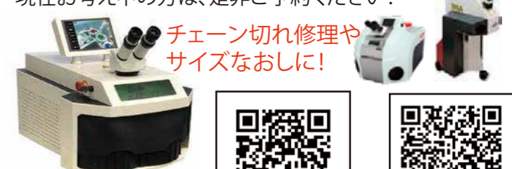
小型レーザー溶接機【SL10】 ¥ 1,430,000 (税別)

レーザー溶接機があればお店でも修理が可能に!他店との差別化にも最適です。でも実際に自分でも出来るのかな。。。そんなお悩みも体験会で解決できます。今回は低価格レーザー溶接機【SL10】を体験できます。現在お考え中の方は、是非ご予約ください!