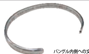
バングル内側への文字彫