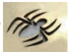
切抜き加工 蜘蛛 真鍮/厚み1.0mm/サイズ 高さ12mm/3分23秒 50W