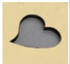
切抜き加工 ハート 真鍮/厚み1.0mm/サイズ 高さ12mm/52秒 50W