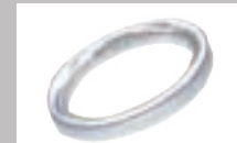
Ptマリッジリングへの文字入れ