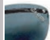
プラスチックへのマーキング