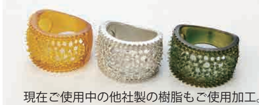
現在ご使用中の他社製の樹脂もご使用加工。

その為、純正樹脂以外にも市販の樹脂がご利用いただけます※1。 実績のある現在お使いの樹脂を、そのままご利用できることはもちろん、多くの樹脂が利用可能なのでご利用の幅は大きく広がります。 さらに、煩わしい樹脂のチップ管理が無い為、時間制限で縛られることなくご利用が可能！ 機械本体価格だけではなく、樹脂に関するランニングコストも大きく節約することができます。