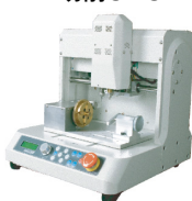
CJ Compact Jet