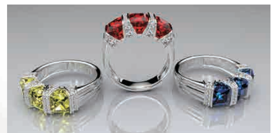
より写実的に見せるレンダリング機能