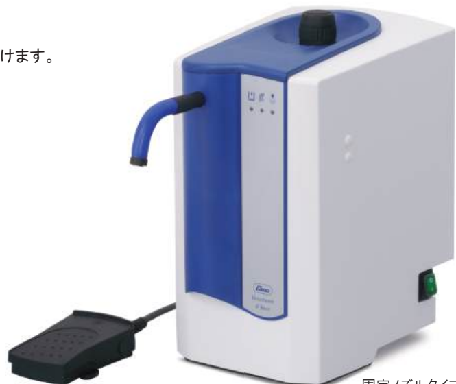
固定ノズルタイプ