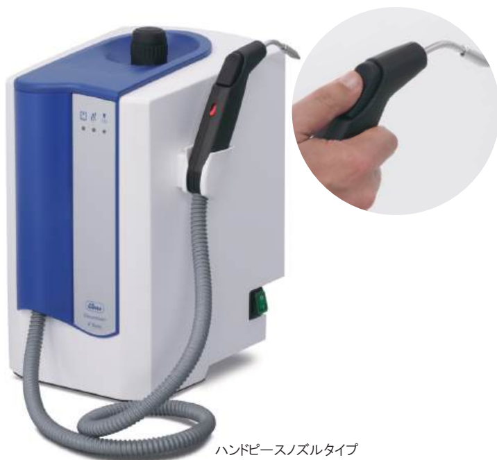
ハンドピースノズルタイプ