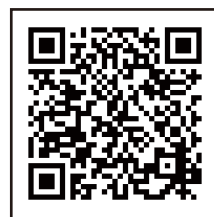
↑セミナーご予約はこちら